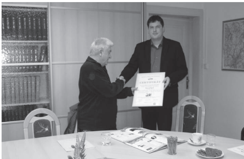
Předání certifikátu o vytvoření rekordu a jeho zápisu do knihy rekordů.