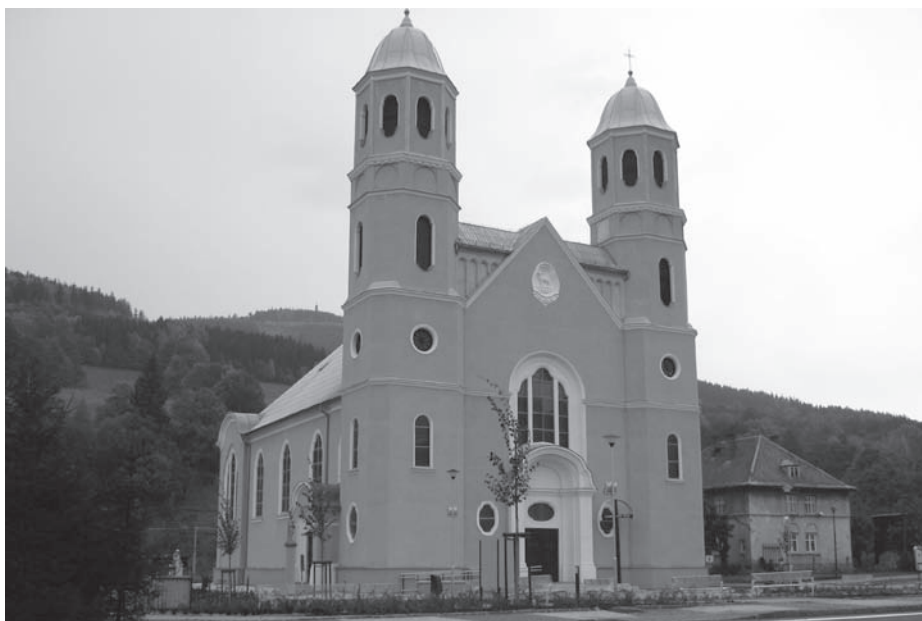
Kostel sv. Josefa v České Vsi