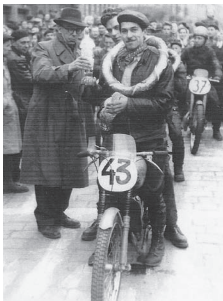
1. místo na ČZ 125 OHC.