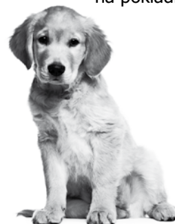
Obecní úřad Česká Ves

Jak: - převodem na účet č. 1905668309/0800, variabilní symbol na vyžádání přidělí pan Kočí - na pokladně obce