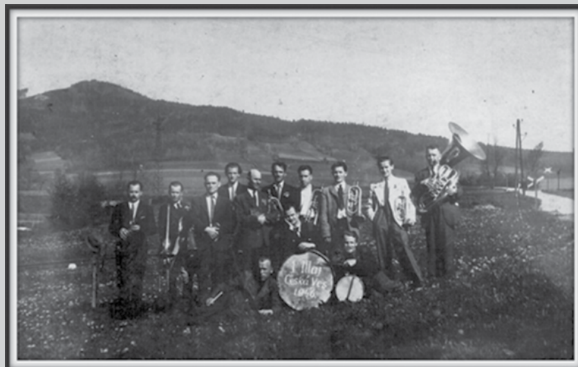
Založení Oškerovy dechovky v roce 1946

V neděli 27. listopadu 2016 jste srdečně zváni oslavit 70. narozeniny s Oškerovou dechovkou. Začínáme ve 14.00 hodin v sále hotelu Zlatý Chlum.