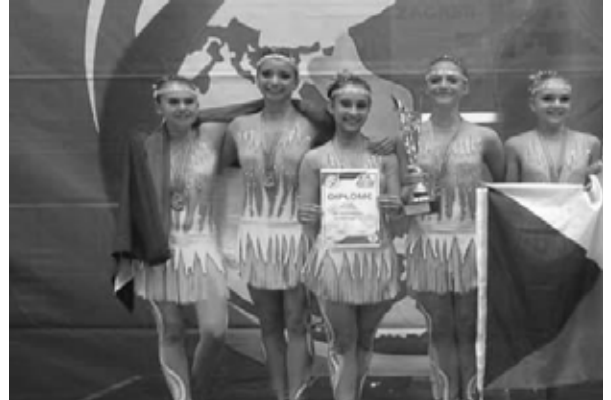
Tým SZUŠ-taneční, s.r.o. Jeseník

Váš příspěvek nám pomáhá ke zkvalitnění bezpečné výuky na naší škole. Děkujeme!