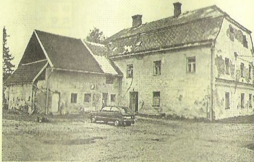
Na opravu čekající byt. dům na ul. Jánského (býv. Soltéztstvi)