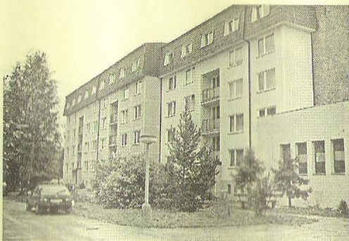
Nové nadstavby na ul. Holanova

krátkém provozu a už se začala psát její historie. Nejen, že nám amatérští umělci vyzdobují interiéry čekárny svými malbami a výřezávkami, ale už jsme museli nechat vyrobit novou tabulku pro jízdní řád. Nejhorší je, že zastávku navštívil zloděj, který se nešťivil vykrást veškeré elektrické zařízení rozvaděče. Způsobil obci škodu ve výši 25 tisíc Kč. Zastávka z tohoto důvodu nebyla po krátkou dobu osvětlena.