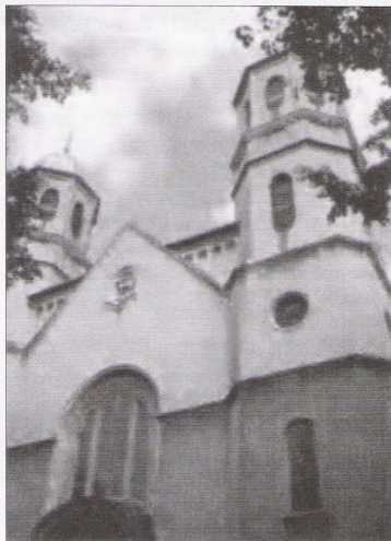
Farní kostel Sv. Josefa Dělníka v České Vsi