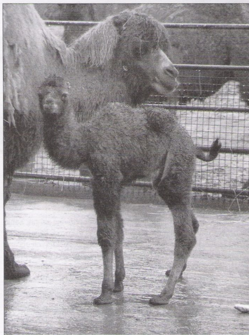
Mláďe velblouda dvouhrbého.

Stanislav Derlich oddělení pro kontakt s veřejností ZOO Ostrava