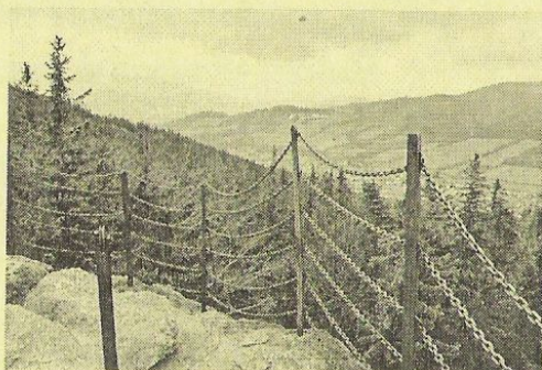
Ilustrační fotografií se vracíme k několika tipům na výlety do našeho okolí. Na snímku je pohled, jaký se naskytne z vrcholu Certových kamenů západním směrem.

Hledám dlouhodobý podnájem 1+1 nebo 2+1 v České Vsi. Mám dva dospělé syny. Starším lidem ráda vypomohu. Jiřina Málíková, tel. 0723/666068 Do zaměstnání ( 6:00 - 14:00 hodin ): 428 184