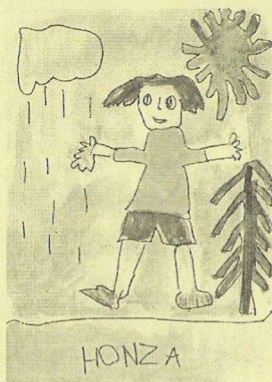
Nakreslil Honza Dvořáček, MŠ Holanova