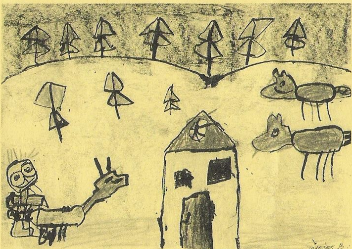
Ilustrace k pohádce „O Budulínkovi“ kresba tuší: Jareček Bambušek, 6 let.