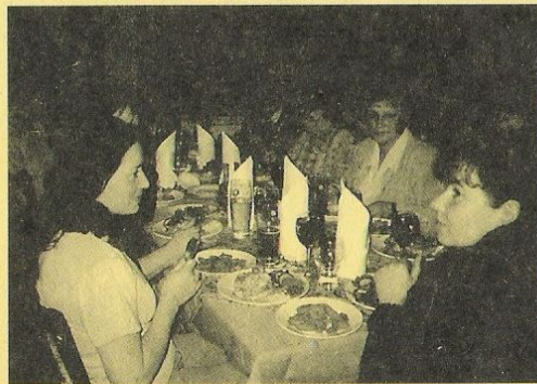
Při plyných stolech se ženám dobře diskutovalo.

Jinak z akcí našich žen je známý Květinový den, pečení koláčů na hody, posezení se staršími spoluobčankami na Den matek a j.