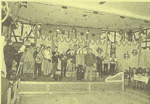
„Civilní“ zkouška dechovky

O naší známé kapele psal náš Zpravodaj podrobněji v květnu minulého roku, kdy slavila 55. výročí založení, resp. obnovy své činnosti v poválečných letech v České Vsi. Její historie je ale mnohem delší a datuje se již od r. 1895, kdy začala hrát ve Valašské vesnici Neobuz v okrese Zlín odkud rod Oškerů pochází. Její časové rozpětí tedy vlastně zasahuje už do třetího století. Těžko lze přesně spočítat kolik bylo horších a lepších let, kolik kapelníků se v jejím čele vystříдалo, ale vždy to byl někdo z rodiny. Dnes je jasné, že pokračovatelé tradic zde jsou i nyní a mají na co navázat.