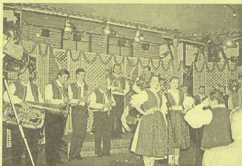
Zde už dechovka natáčí „naostro“