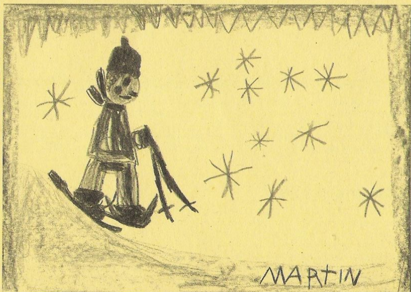
Obrázek lyžaře nakreslil Martin Grešák

V polovině ledna několik našich starších dětí navštěvovalo Lyžařskou školičku v Lipové Lázních. Po