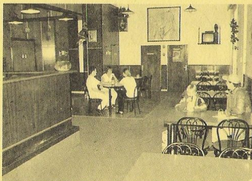
Občerstvení – jídlo i bar v restauraci Poseidon přímo v budově

Bazén je rovněž výchozím bodem k vycházkám po okolí. Navštivte nás – nasměrujte své hosty!