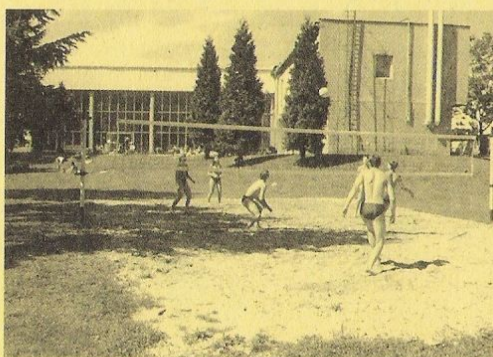
V létě slunění a hry na zahradě – za letní vstupné!