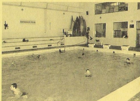
Bazén 25x10m, voda 26°C, sušárna, sprchy, výuka plavání.

V průběhu roku mohou být změny v otevírací době – informujte se na tel. č.