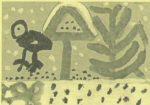
Obrázek nakreslila Dominika Vršanová