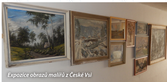
Expozice obrazů malířů z České Vsi