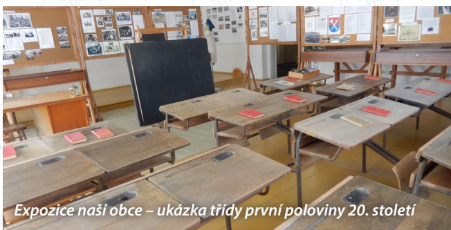
Expozice naší obce – ukázka třídy první poloviny 20. století

Za MŠ Holanova Hana Neubauerová