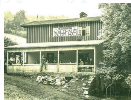
△ Restaurace Lesní domov – Ovčí paseka (rok 1934)

Informace čerpány z knihy Drei Dörfer im Altvaterland: Böhmischdorf, obou německy psaných kronik obce Česká Ves a vlastního dlouholetého pátrání v oblasti zajateckých táborů na Jesenícku.