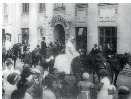
△ Svatební pár v průvodu před továrním hotelem (před rokem 1945; z knihy Drei Dörfer im Altvaterland: Böhmischdorf)

Budova hostince Scholzenrasthof pochází někdy z let 1800 (dnešní Závodní hostinec). V roce 1917 jej získala společnost Eisenindustrie AG (dnešní Řetězárna). Po akvizici byl přestavěn železářským průmyslem a v horním patře vznikla krásná hala s pódiumem. K dispozici bylo také šest pokojů pro hosty. Za hostincem stála nová moderní bowlingová dráha a také tenisový kurt pro pracovníky a hosty továrny. Oblíbeným místem, zvláště v horkých letních dnech, byla zahrada s posezením pod kaštaný.