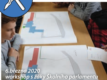
6. března 2020 workshop s žáky Školního parlamentu