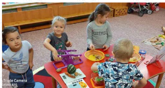
Triple Camera Galaxy A50